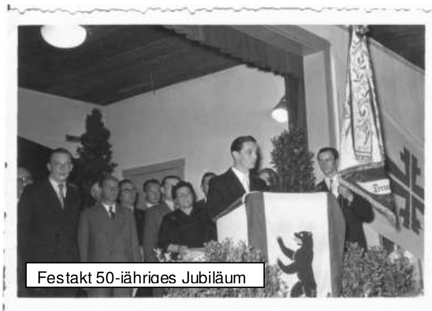
Festakt 50-jähriges Jubiläum

Die Arbeiten und Planungen für die Festschrift gehen weiter voran. Die Beschaffung von Informationen aus den letzten knapp 100 Jahren stellt sich manchmal schwierig dar, aber mit „verbissenem“ Einsatz gelingt es den Ausschußmitgliedern immer wieder, Quellen aufzutun, die interessante Materialien liefern. Neben Institutionen wie Amtsgerichte, Kirchenarchive, Heimatmuseen, Zeitungsarchive etc. sind auch erfreulicherweise ehemalige und aktive Vereinsmitglieder auf uns zugekommen, um uns mit Bildern und Dokumenten zu versorgen. Herzlichen Dank und weiter so!!!